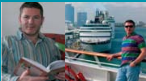
Na jednej z plavieb Karibikom. Miami, USA