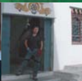
Míkloš Ivan, Ing. poslanec NR SR, exminister financií

S BUBOm som ešte nikdy nikde nebol, napriek tomu s čistým svedomím s ním odporúčam cestovať. Pravidelným klientom bol môj otec, kým žil a v posledných rokoch je vernou a pravidelnou klientkou BUBA moja manželka. Ja cestujem po svete „na divoko“, bez cestovky, ale keby som mal s nejakou ísť, určite by to bol BUBO. Odporúčam každému, kto chce zažiť a vidieť viac ako luxusné getá uzavretých, izolovaných all inclusive rezortov, kto chce naozaj spoznať ľudí, históriu, kultúru, prírodu, zvyky v rôznych kútoch sveta a nechce sa mu organizovať cesty vo vlastnej réžii, BUBO je ideálne riešenie. Na vlastnej koži som zažil atmosféru festivalu CAMERA Slovakia, kde som premietal obrázky z našej cesty po Bhutánu, a aj táto skúsenosť ma presvedčila, že BUBO je profík. Prajem veľa vzrušujúcich zážitkov pri spoznávaní sveta.