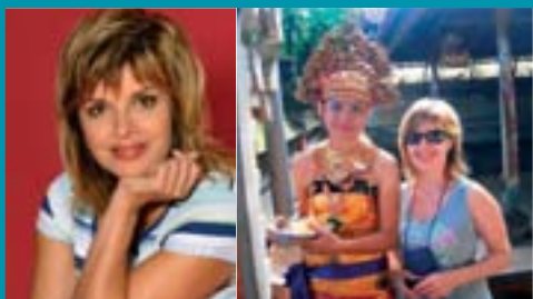
Na Silvestra na Bali, Indonézia

V minulosti sme nemali možnosť cestovať, lebo nám to predchádzajúci systém neumožnil. Po nežnej revolúcii sa aj nám otvoril svet a snažíme sa to plne využiť. Splníame si svoje doteraz nespĺnené sny. Posledné roky sme vyskúšali cestovnú kanceláriu BUBO. Obaja môžeme konštatovať, že plne k našej spokojnosti. Nepatríme totiž k tým turistom, ktorí vyhládávajú len slnko a vodu. Vábi nás skôr poznávať cudzie krajiny, ich ľudí, kultúru a históriu. CK BUBO sa ukázala pre tieto naše požiadavky ideálnym partnerom. Osobitne chcem vyzdvihnúť fakt, že má nielen skvelý program, ale aj vynikajúcich sprievodcov, ktorí dobre ovládajú nielen históriu, ale aj realie krajiny, ktoré sme navštívili. Určite i v budúcnosti využijeme ich služby a môžeme ich vrele odporučiť každému náročnému turistovi.