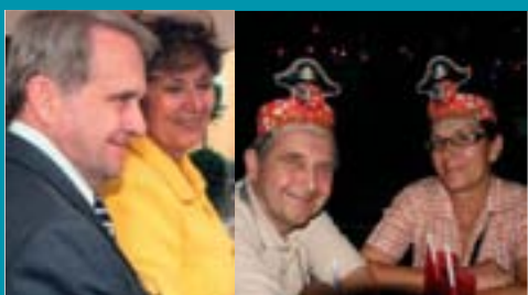
Na diskotéke v Acapulcu, Mexiko