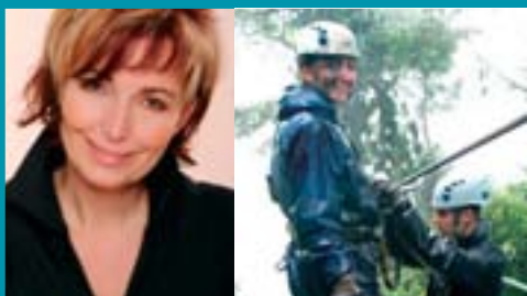
Sky-trek, arenalská džungľa, Kostarika

Hnacou silou mnohých, ktorí sa rozhodli cestovať býva poznávanie nových svetov, nových ľudí, iných kultúr ale aj oslobodenie sa od denných starostí. Pre mňa to však určite nie sú destinácie uzavretých rezortov, sterilných turistických lokalít, ktoré sú súčasťou tzv. turistického businessu. Mám rád cesty, kde možno vidieť život tak, ako ho miestni naozaj prežívajú (aj s vyprázanými marinovanými kobyľkami ale aj úžasnými pyramídami v Mexickej džungli). BUBO ponúka práve takéto cesty, výborne organizované, so skvelými sprievodcami (do dnes spomínam na vodopády Agua Azul v Mexiku, kde mi v poslednej chvíľke pomohli dostať sa z prúdov), cestami, kade bežné turistické kancelárie nechodia. Jedným slovom BUBO ponúka vo vynikajúcej kvalite to, čo iní neposkytujú. Prajem "Bubákom" a ich klientom skvelé nové zážitky pri objavovaní krásy a jedinečnosti tejto planéty.