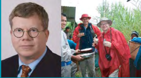
Na expedícii v Nagalande - India