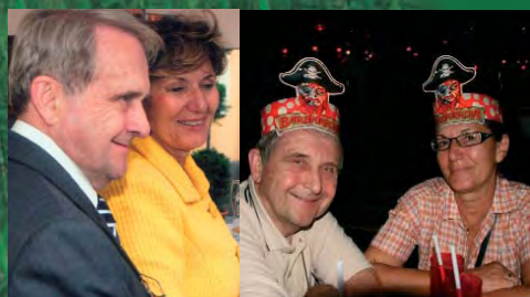
Na diskotéke v Acapulcu, Mexiko