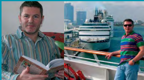
Na jednej z plavieb Karibikom. Miami, USA

S priateľmi z cestovnej kancelárie BUBO cestujem už od minulého tisícročia, presnejšie od roku 1999. Bolo toho dosť, čo sme spolu prešli. Vždy ma na ich programe lákalo, že ponúkajú niečo, čo iní nie, pritom je zájazd precízne zorganizovaný a skvele sprevádzaný. Vždy sa im darilo nájsť zaujímavé, no ešte masovou turistikou neobjavené miesta, kde sa môžete rukou dotýkať aj starých sôch a vidíte na vlastné oči ako to tam mohlo byť pred desiatkami či stovkami rokov. To je v dnešnom svete zriedkavý zážitok. Uvedomíte si to, až keď sa odtiaľ vrátite, prezeráte fotky a pýtate sa sám seba – to som tam naozaj bol? Taký pocit som mal po príchode z Barmy, Jemenu, Gruzínska či Uzbekistanu..... Verím, že aj naďalej sa im bude dať objavovať s nami zákraky tohto sveta a zažijeme spolu ešte mnoho neošedých momentov.