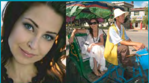
Na rikši v Kathmandu, Nepál