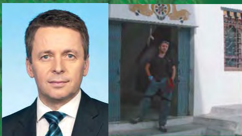
Na trekingu v Bhutáne

Som zvedavý človek, a preto rád cestujem. Mám rád jednoduchých ľudí, ktorí nemusia od októbra pozeráť v televízii reklamy o Vanociach. Ktorí si nezavidia a neriešia problémy tohto chorého konzumného sveta. Mám rád krajiny, v ktorých títo ľudia ešte žijú a zdá sa mi, že sú šťastnejší, ako my. Krajiny, v ktorých úsmev je naozaj dar, a nie charita. Sú to paradoxne materiálne tie najchudobnejšie krajiny s bohatou kultúrou a tradíciou, silne spojené so zemou, čo nás živí. Zanechávajú vo mne tú najsilnejšiu stopu a emóciu. Preto má pre mňa zmysel za nimi vycestovať a to mi BUBO s ich skvelými sprievodcami umožňuje.