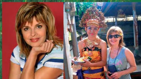
Na Silvestra na Bali, Indonézia

V minulosti sme nemali možnosť cestovať, lebo nám to predchádzajúci systém neumožnil. Po nežnej revolúcii sa aj nám otvoril svet a snažíme sa to plne využiť. Splňame si svoje doteraz nespĺnené sny. Posledné roky sme vyskúšali cestovnú kanceláriu BUBO. Obaja môžeme konštatovať, že plne k našej spokojnosti. Nepatríme totiž k tým turistom, ktorí vyhládávajú len slnko a vodu. Vábi nás skôr poznávanie cudzie krajiny, ich ľudí, kultúru a históriu. CK BUBO sa ukázala pre tieto naše požiadavky ideálnym partnerom. Osobitne chcem vyzdvihnúť fakt, že má nielen skvelý program, ale aj vynikajúci sprievodcov, ktorí dobre ovládajú nielen históriu, ale aj realie krajiny, ktoré sme navštívili. Určite i v budúcnosti využijeme ich služby a môžeme ich vrele odporučiť každému náročnému turistovi.