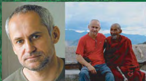
V kláštore Ganden, Tibet