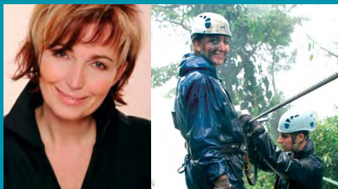
Sky-trek, arenalská džungľa, Kostarika

Hnacou silou mnohých, ktorí sa rozhodli cestovať býva poznávanie nových svetov, nových ľudí, iných kultúr ale aj oslobodenie sa od denných starostí. Pre mňa to však určite nie sú destinácie uzavretých rezortov, sterilných turistických lokalít, ktoré sú súčasťou tzv. turistického businessu. Mám rád cesty, kde možno vidieť život tak, ako ho miestni naozaj prežívajú (aj s vyprázanými marinovanými kobyľkami ale aj úžasnými pyramídami v Mexickej džungli). BUBO ponúka práve takéto cesty, výborne organizované, so skvelými sprievodcami (do dnes spomínam na vodopády Aqua Azul v Mexiku, kde mi v poslednej chvíľke pomohli dostať sa z prúdov), cestami, kde bežné turistické kancelárie nechodia. Jedným slovom BUBO ponúka vo vynikajúcej kvalite to, čo iní neposkytujú. Prajem "Bubákom" a ich klientom skvelé nové zážitky pri objavovaní krásy a jedinečnosti tejto planéty.