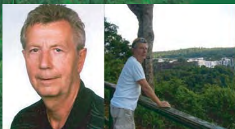
Pri vodopádoch Iguazu, Brazília

S BUBO som ešte nikdy nikde nebol, napriek tomu s čistým svedomím s ním odporúčam cestovať. Pravidelným klientom bol môj otec, kým žil a v posledných rokoch je vernou a pravidelnou klientkou BUBA moja manželka. Ja cestujem po svete „na divoko“, bez cestovky, ale keby som mal s nejakou ísť, určite by to bol BUBO. Odporúčam každému, kto chce zažiť a vidieť viac ako luxusné getá uzavretých, izolovaných all inclusive rezortov, kto chce naozaj spoznať ľudí, históriu, kultúru, prírodu, zvyky v rôznych kútoch sveta a nechce sa mu organizovať cesty vo vlastnej režií, BUBO je ideálne riešenie. Na vlastnej koži som zažil atmosféru festivalu CAMERA Slovakia, kde som premietal obrázky z našej cesty po Bhutáne, a aj táto skúsenosť ma presvedčila, že BUBO je profík. Prajem veľa vzrušujúcich zážitkov pri spoznávaní sveta.